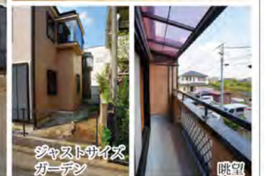
ジャストサイズガーデン 眺望