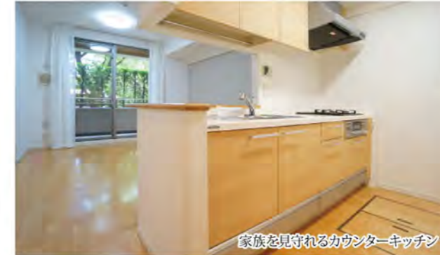
家族を見守れるカウンターキッチン