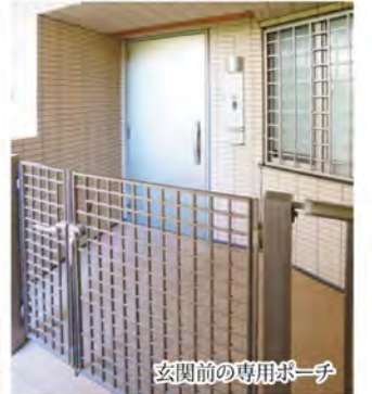
玄関前の専用ポーチ