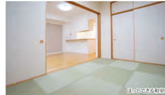
ほっとできる和室