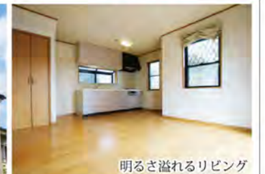
明るさ溢れるリビング