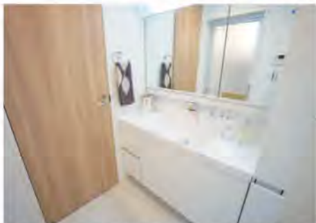
収納たっぷり・ワイドな三面鏡で ゆったりパウダールーム