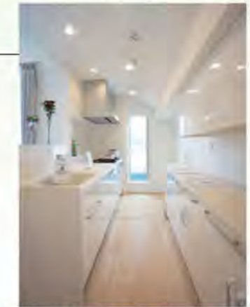
リビングが見える明るいキッチン