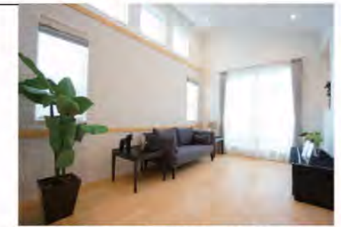
窓がたっぷり明るいリビング