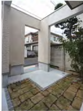
都内で庭付きなんて!!