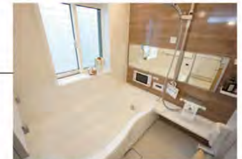
大きなテレビでくつろぎバスタイム